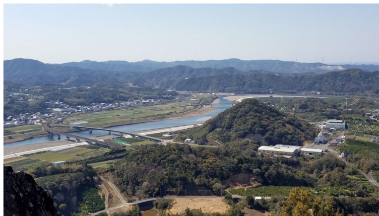
三国岩山から和佐方面を望む